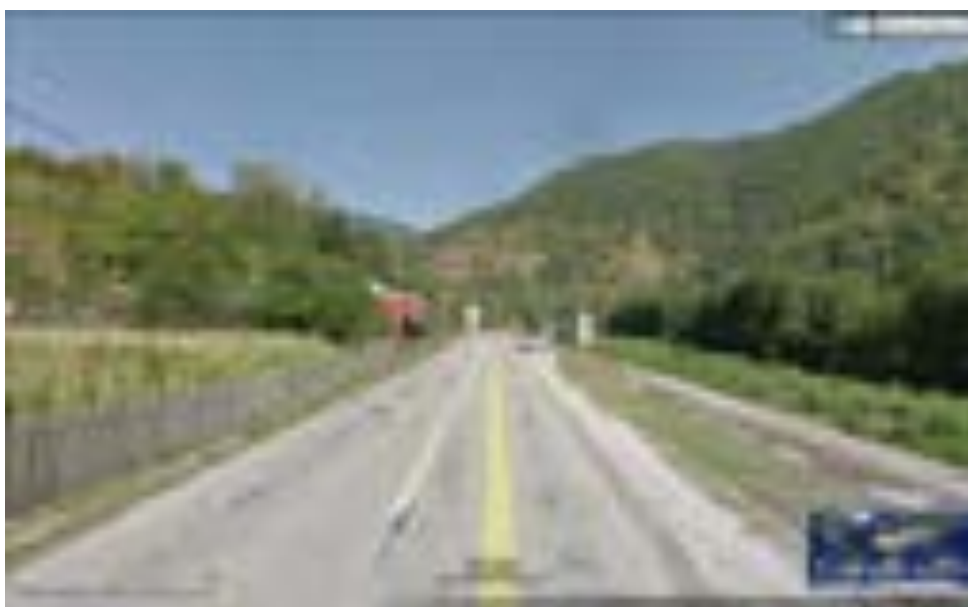
Imagine Satul Săliște