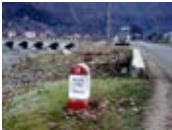
BORNA KILOMETRICĂ 14