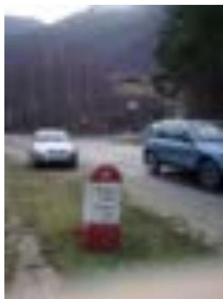
BORNA KILOMETRICĂ 16