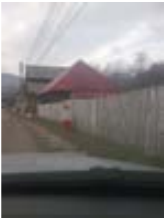
BORNA KILOMETRICĂ 24