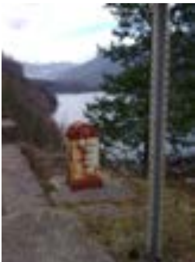
BORNA KILOMETRICĂ 19