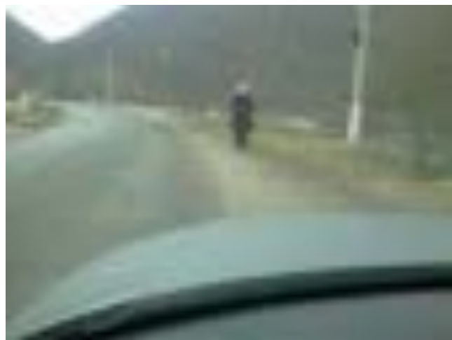
BORNA KILOMETRICĂ 29