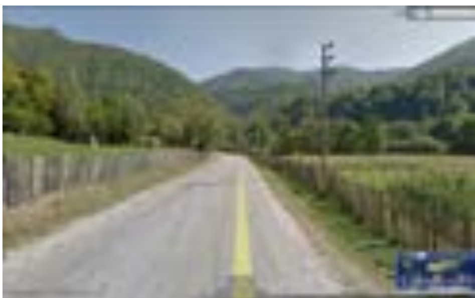
Imagine Satul Ciunget