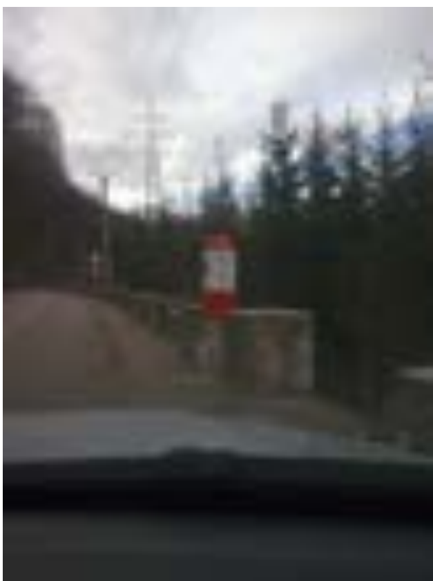
BORNA KILOMETRICĂ 20