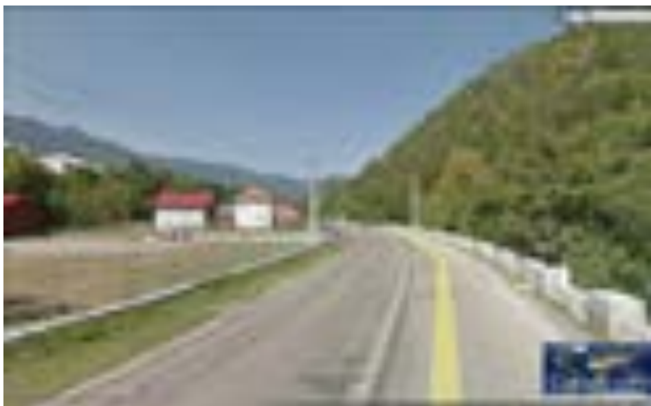
Imagine Satul Malaia (Școala )