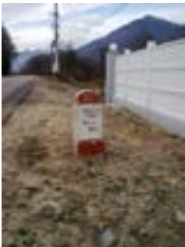
BORNA KILOMETRICĂ 21