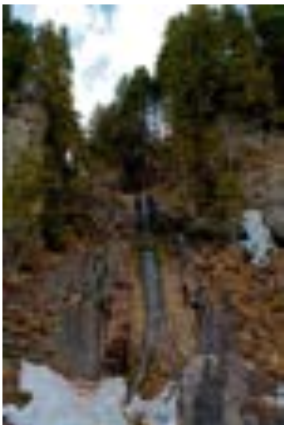
Imagini cu Cascada Apa Spânzurată

Are o inaltime de 35 de metri. Frumusetea cascadei se poate admira din masina, in drum spre Complexul Turistic Tudor Petrimanu.