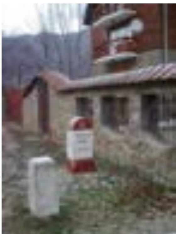
BORNA KILOMETRICĂ 13