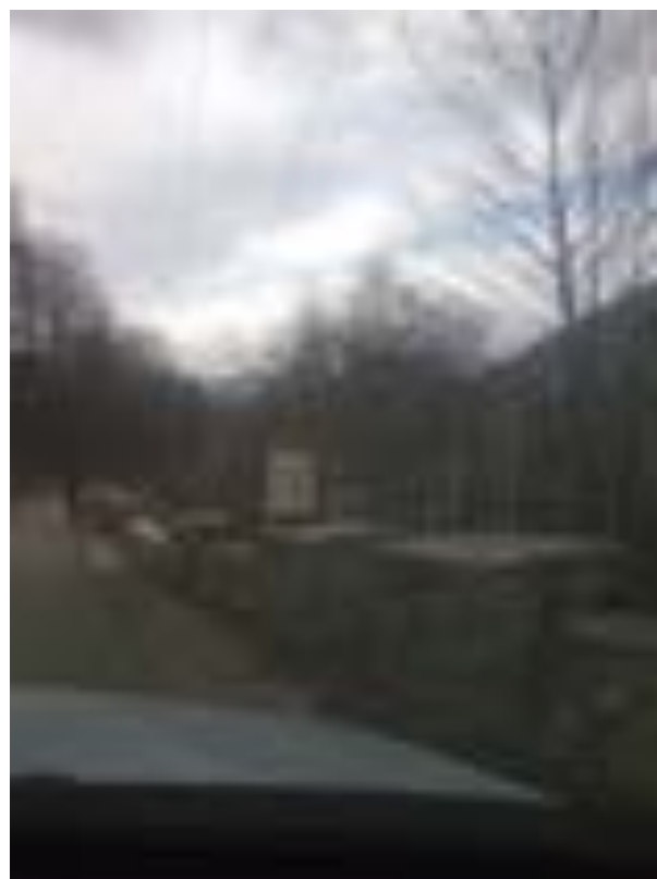
BORNA KILOMETRICĂ 22