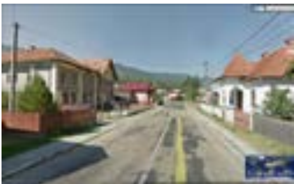
Imagine Satul Malaia - amenajare trotuar pe partea stângă a carosabilului și rigolă betonată acoperită pe partea dreapta.