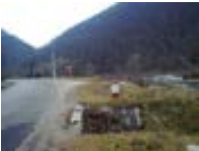
BORNA KILOMETRICĂ 30