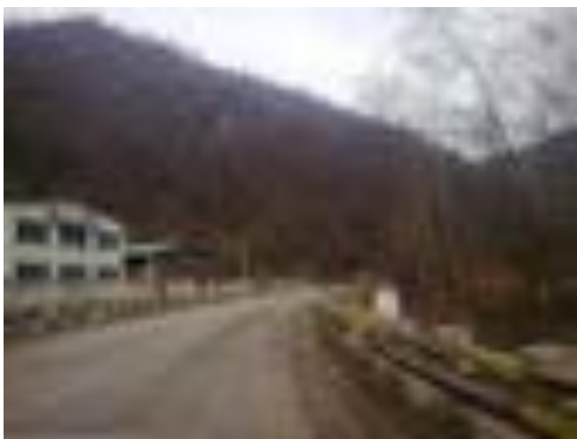
BORNA KILOMETRICĂ 28