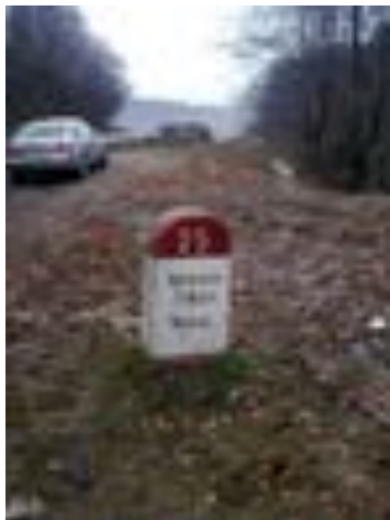
BORNA KILOMETRICĂ 25