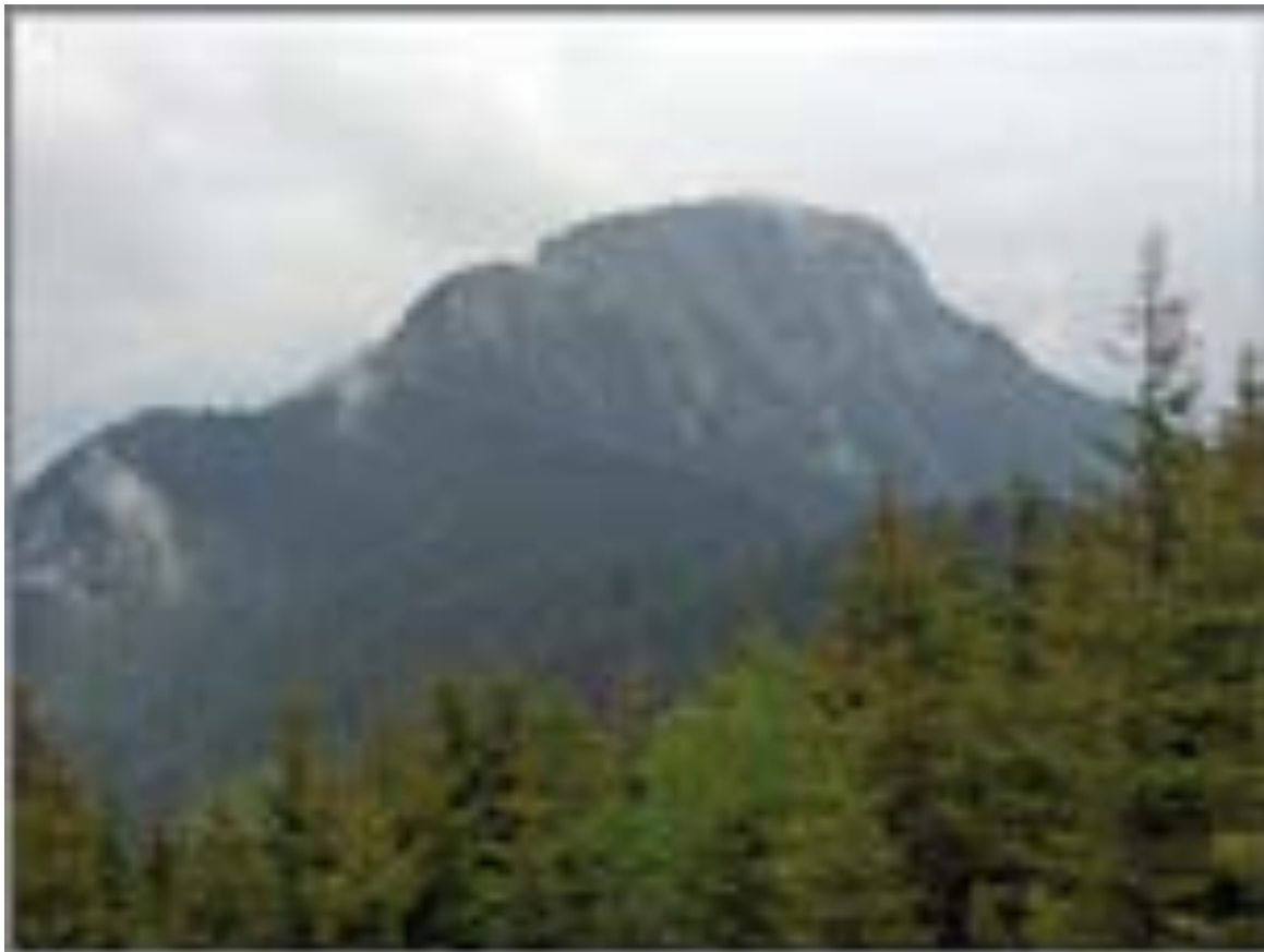
Figura 1. Piatra Tarnovului – Vedere dinspre vest