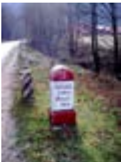
BORNA KILOMETRICĂ 15