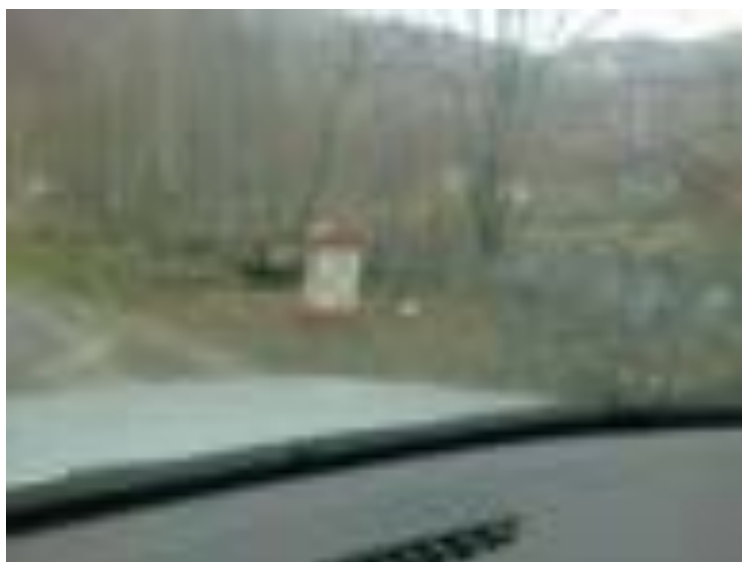
BORNA KILOMETRICĂ 28