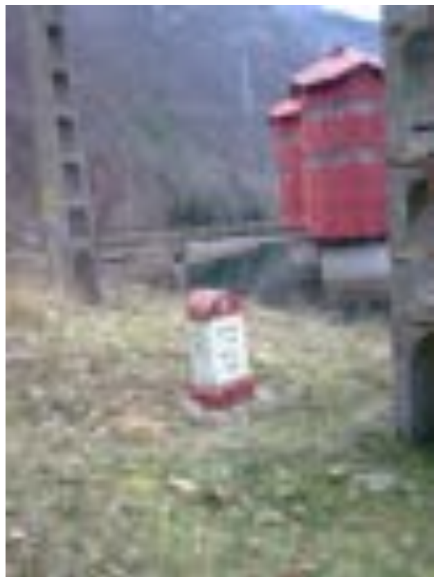
BORNA KILOMETRICĂ 18