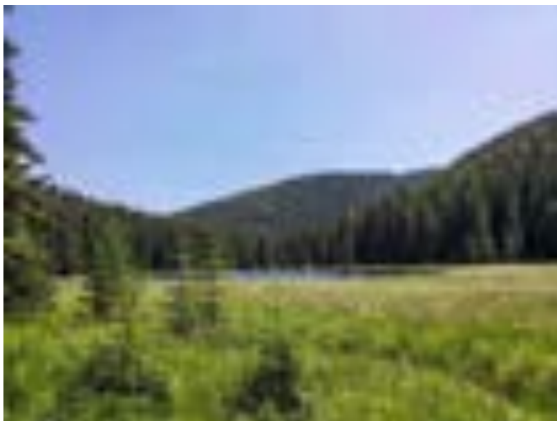
Lacul Iezerul Latoriței

Căi de acces : Din D.N.67 C Brezoi- Voineasa se urmează șoseaua către satul Ciunget ,se continuă cu drumul de pe valea Latorița (parțial modernizat ), cca. 30 km., înspre lacurile Petrimanu și Galbenu. De la coada lacului Galbenu se urmează poteca nemarcată ,în susul văii Latorița de Mijloc.