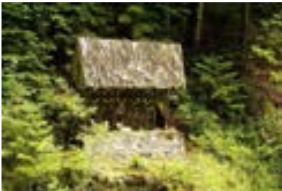
Monumentul "7 Cruci"

Monument ridicat in in memoria unor muncitori ucisi de o avalansa in timpul amenajarii Hidrocentralei Lotru-Ciuget.