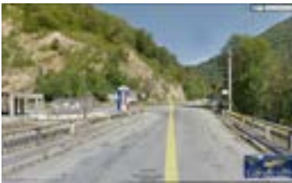
Direcția dinspre Malaia spre Voineasa , respectiv Ciunget