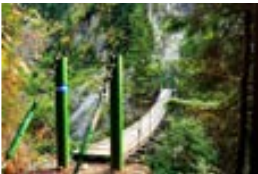
Pod peste Râul Latorița în apropiere de Barajul Galbenu

- Lacul Galbenu - Lac de acumulare care de asemenea alimentează Lacul Vidra. Se afla în amonte de Lacul Petrimanu, la 1304m altitudine, între Muntele Balescu și Muntele Galbenu, având o suprafață de 17 ha și o adâncime de 49m. Barajul Galbenu are o înălțime de 60 de metri iar apa se transportă către Lacul Vidra printr-o galerie subterană în Munții Latoritei prin cadere naturală (captare gravitațională).