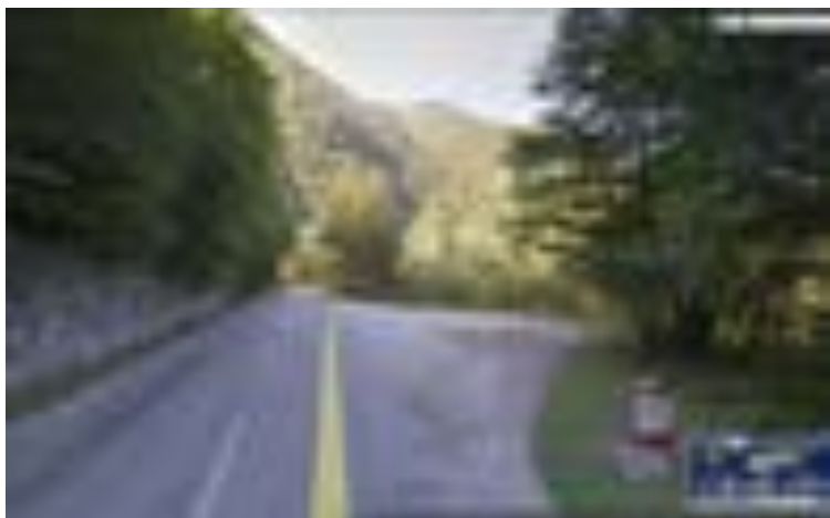
BORNA KILOMETRICĂ 12