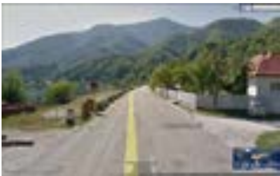
BORNA KILOMETRICĂ 23