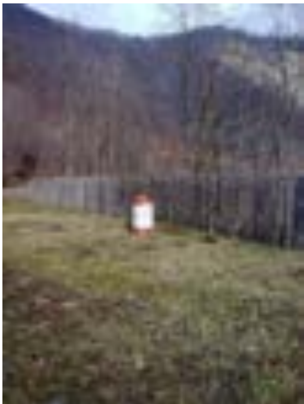
BORNA KILOMETRICĂ 17