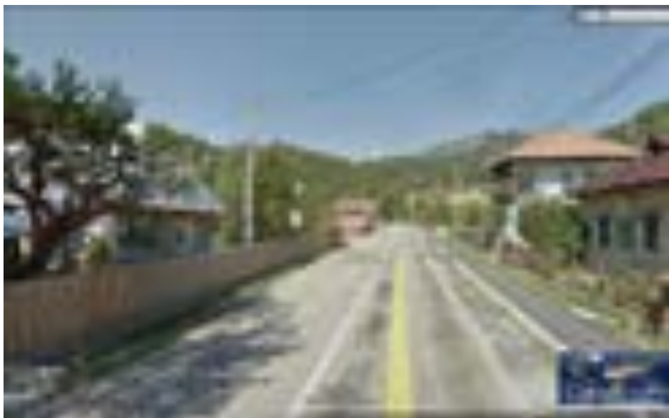
Imagine Satul Săliște - amenajare trotuar pe partea dreaptă a carosabilului și rigolă înierbată pe partea stângă.

Partea carosabilă are o lățime de 6,00 m – 7,00 m cu două benzi asfaltate incluzând și banda de încadrare . Partea carosabilă este mărginită pe o parte de trotuar , iar pe cealaltă parte de șanțuri pentru preluarea apelor pluviale . Aceste șanțuri sunt de două tipuri : înierbate , deschise și betonate , acoperite cu rigole beton. De menționat este faptul că trotuare sunt doar în zonele centrale ale satelor Săliște ( pe aprox. 345m) de la Km 13 +590 – KM13+935 și Malaia (pe aprox. 1320 m) KM 23 +430 – KM 24+750.