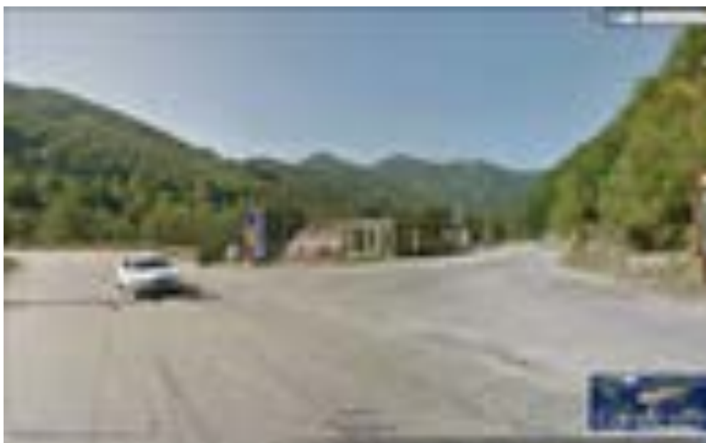
Direcția dinspre Voineasa spre Malaia , respectiv Ciunget

Rezolvarea intersecției drumului național 7A cu drumul județean 701 D constând în marcarea și semnalizarea direcțiilor de mers;