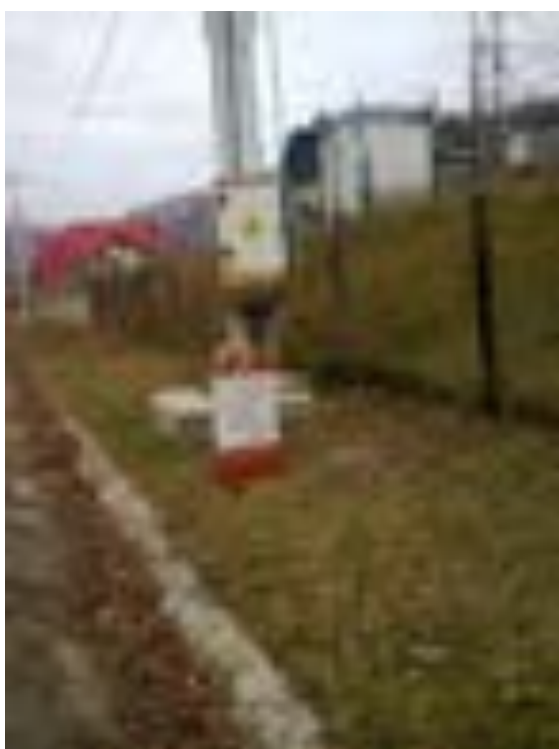
BORNA KILOMETRICĂ 26